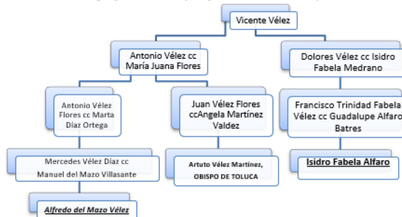
Figura 1. Genealogía que muestra el lejano parentesco entre Fabela y Del Mazo

Nota: cc= casó con.